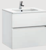
Jade 59,5 x 44,5 cm p. 308