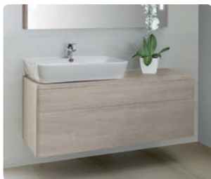
Emma p. 322 / Emma square p. 314

Es una plancha formada por poliuretanos y plásticos, prensados sobre un tablero de DM, donde se pueden hacer trabajos decorativos finales muy variados. Es moldeable y se adapta a los pequeños espacios o irregulares permitiendo la realización de relieves, molduras, marcos, etc. Es un material novedoso, muy resistente e impermeable al agua.