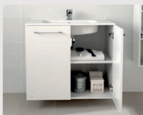
Nura p. 310