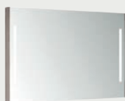
Emma Square 120 x 80 cm p. 332