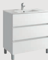
Jade 79,7 x 44,7 cm p. 304