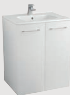
Nura 60 x 46 cm p. 312