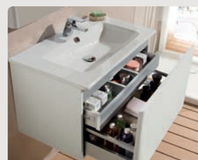
Emma p. 322