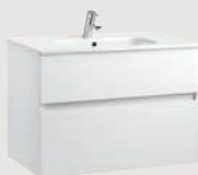
Jade 79,5 x 44,5 cm p. 308