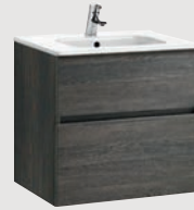
Jade 59,5 x 44,5 cm p. 308