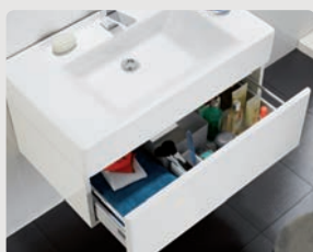
Casual p. 326