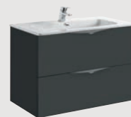
Ágata 79,7 x 45,3 cm p. 300