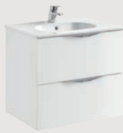
Ágata 59,7 x 45,3 cm p. 300