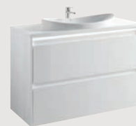
Klea 98,5 x 45 cm p. 292 Encimera / Countertop À encastrer / Столешница