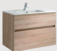
Jade 79,5 x 44,5 cm p. 308