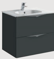
Ágata 59,7 x 45,3 cm p. 300