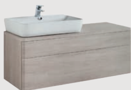
Emma Square 120 x 45 cm p. 318