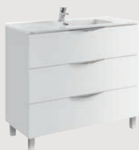
Ágata 99,7 x 45,3 cm p. 296

3 cajones | 3 drawer | 3 tiroirs | 3 выдвижных ящика