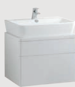
Emma Square 60 x 45 cm p. 320