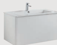
Emma 80 x 45 cm p. 324