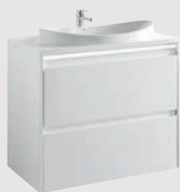
Klea 78,5 x 45 cm p. 292 Encimera / Countertop À encastrer / Столешница