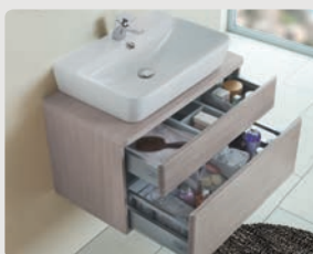
Emma Square p. 314