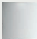
Nura 80 x 80 cm p. 332