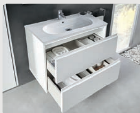
Klea p. 286

Interior drawers and room | Tiroirs intérieurs et capacité | Внутренние ящики и емкость: