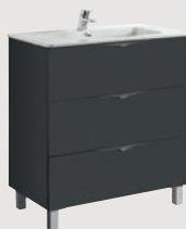
Ágata 79,7 x 45,3 cm p. 296