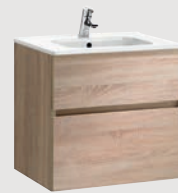
Jade 59,5 x 44,5 cm p. 308