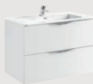
Ágata 79,7 x 45,3 cm p. 300