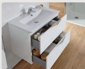
2 CAJONES LACADO BLANCO BRILLO 2 DRAWERS WHITE GLOSS LACQUER 2 TIROIRS LAQUÉ BLANC BRILLANT 2 ВЫДВИЖНЫХ ЯЩИКА БЕЛЫЙ ГЛАНЦЕВЫЙ ЛАК