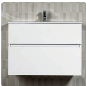
Jade p. 302 / Nura p. 310

Es una lámina impregnada de resina melamínica prensada sobre un tablero de aglomerado. Durante el proceso de fabricación se produce la polimerización de la melamina que se introduce en los poros del tablero, proporcionando un agarre perfecto. La melamina es un material muy fácil de limpiar, resistente a la acción de agentes externos como la erosión, el rayado, las altas temperaturas etc. Es un material económico, fácilmente adaptable, y muy versátil ya que se puede fabricar en diferentes colores, tonos y acabados.