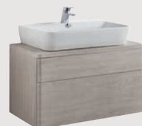
Emma Square 80 x 45 cm p. 319