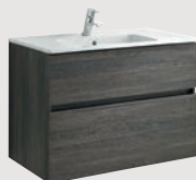
Jade 79,5 x 44,5 cm p. 308