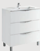
Ágata 79,7 x 45,3 cm p. 296

3 cajones | 3 drawer | 3 tiroirs | 3 выдвижных ящика