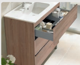
3 CAJONES ROBLE BARDOLINO 3 DRAWERS BARDOLINO OAK 3 TIROIRS CHÊNE BARDOLINOT 3 ВЫДВИЖНЫХ ЯЩИКА ДУБ BARDOLINO