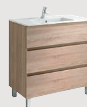
Jade 79,7 x 44,7 cm p. 304