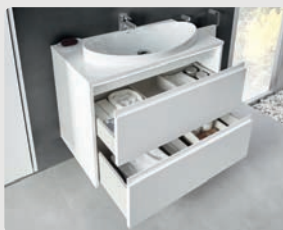
ENCIMERA / COUNTERTOP À ENCASTRER / СТОЛШНИЦА