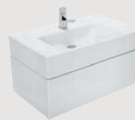
Casual 59,7 x 46,6 cm p. 327