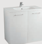
Nura 80 x 46 cm p. 312