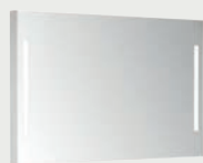
Emma Square 120 x 80 cm p. 332