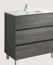
Jade 79,7 x 44,7 cm p. 304