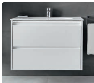
Klea p. 286 / Ágata p. 294 / Casual p. 326

Se recubre la superficie del tablero, normalmente DM, con pintura laca que produce un acabado de dureza que puede ir desde el brillo al mate. Es un acabado muy moderno, elegante y versátil que se puede obtener en multitud de colores y tonalidades. De acabado liso y perfecto, es además impermeable al agua.