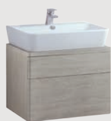
Emma Square 60 x 45 cm p. 320