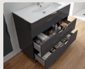
3 CAJONES LACADO GRIS BRILLO 3 DRAWERS GREY GLOSS LACQUER 3 TIROIRS LAQUÉ GRIS BRILLANT 3 ВЫДВИЖНЫХ СЕРЫЙ ГЛАНЦЕВЫЙ ЛАК