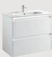
Klea 78,5 x 45 cm p. 288

2 cajones | 2 drawer | 2 tiroirs | 2 выдвигающих ящика