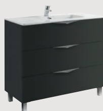
Ágata 99,7 x 45,3 cm p. 296

2 cajones | 2 drawers | 2 tiroirs | 2 выдвижных ящика