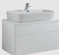
Emma Square 80 x 45 cm p. 319