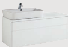
Emma Square 120 x 45 cm p. 318