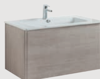
Emma 80 x 45 cm p. 324