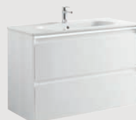
Klea 98,5 x 45 cm p. 288

2 cajones | 2 drawers | 2 tiroirs | 2 выдвижных ящика