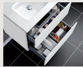
2 CAJONES LACADO BLANCO BRILLO 2 DRAWERS WHITE GLOSS LACQUER 2 TIROIRS LAQUÉ BLANC BRILLANT 2 ВЫДВИЖНЫХ ЯЩИКА БЕЛЫЙ ГЛАНЦЕВЫЙ ЛАК